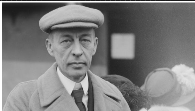
Serguei Rachmaninov ↑