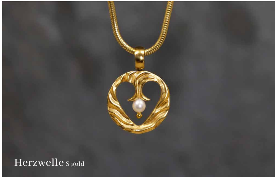
Herzwelle S gold