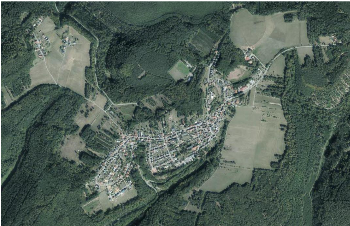
Luftbild der Ortsgemeinde Leimen

Das vorliegende Konzept wurde mit Engagement der Bürgerinnen und Bürger sowie der Arbeitskreismitglieder erstellt und wird in Zukunft regelmäßig aktualisiert.