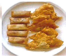
*K19 Mini-Frühlingsrolle & Frittierte Wan-Tan 3,80 €