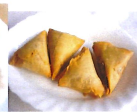
K12 牛肉咖喱角 Rindfleisch (Curry) 3,80 €