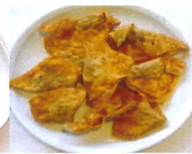
*K13 Frittierte Wan-Tan Schweinefleisch 3,00 €