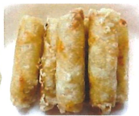
*K18 越南鸡肉春卷 Chicken Frühlingsrolle 4,00 €