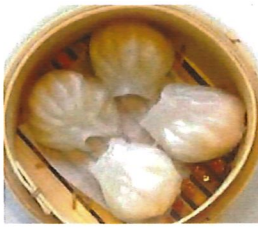
K1 虾饺 Garnelen Ha Gao 4,00 €