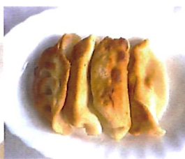
K9 煎饺* Schweine. Maultaschen 4,00 €