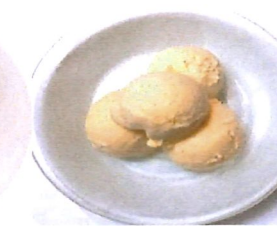
118 Vanilleeis 3,00 €