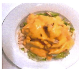
16 Salat mit Hühner- und Entenfleisch 5,50 €