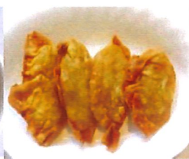
K8 虾肉馄饨 Garnelen Wan Tan 4,20 €