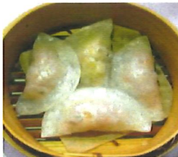
K6 粉果 Schweine. Fen Guo 3,80 €