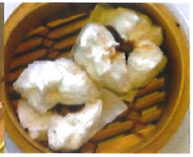
K5 叉烧包 Schweine. Cha Shao Bao 3,80 €