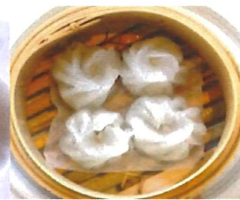
K13 水晶包 Schweine. Shui Jing Bao 3,80 €