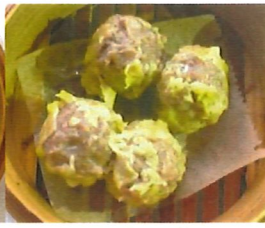
K4 牛肉烧卖 Rindfleisch Shao Mai 3,80 €