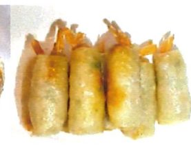
*K17 虾春卷 Frühlingsrolle Garnelen 4,20 €