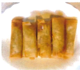
*K11 素小春卷 Mini-Frühlingsrolle (Vegan) 3,80 €