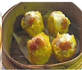
K14 猪肉烧卖 Schweine. Shao Mai 3,80 €