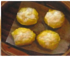
K2 虾烧卖 Garnelen Shao Mai 4,00 €