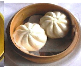
K7 素包子 Veget. Bao Zi mit Eier 3,50 €