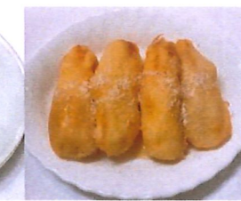
119 Gebackene Banane mit Honig 3,00 €