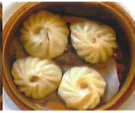
K3 小笼包 Schweine. Xiao Long Bao 3,80 €