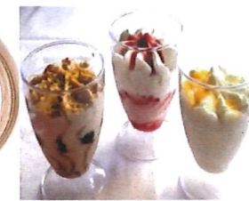
124 Eisbecher Nuss / Zitronen / Kirsch 3,00 €