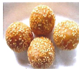
K16 麻团 Ma Tuan (Süß) Frittierte Rotbohnenpaste 3,80 €