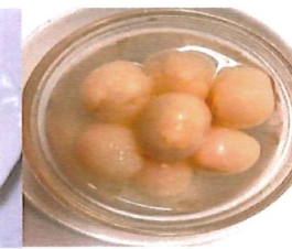
123 Lychees 3,00 €